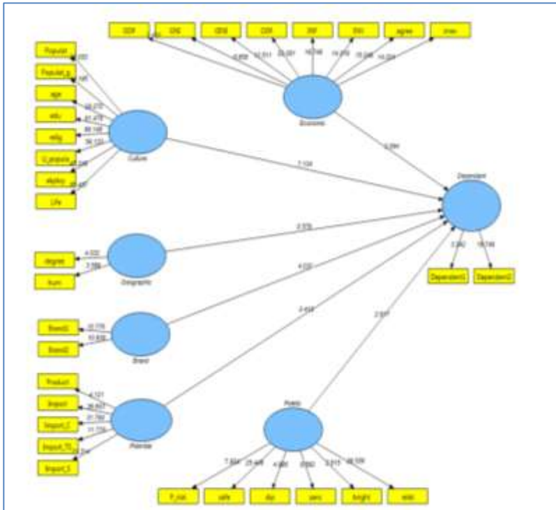
شکل ۳. اعداد معنی داری مدل ساختاری پژوهش