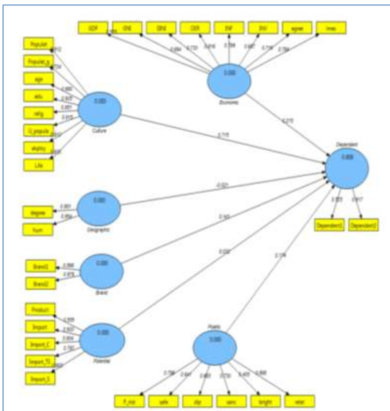
شکل ۲. ضرایب تخمین استاندارد مدل ساختاری پژوهش

در این بخش ابتدا به ترسیم مدل اندازه گیری اولیه در حالت تخمین ضرایب استاندارد پرداخته و سپس نتایج به دست آمده را تفسیر و اقدامات اصلاحی لازم را انجام می‌دهیم. همچنین مدل اندازه‌گیری اولیه در حالت معناداری ضرایب نیز بیان خواهد شد. شکل ۲ ضرایب تخمین استاندارد را در هر مسیر و شکل ۳ اعداد معنی‌داری مدل ساختاری پژوهش را نشان می‌دهد.