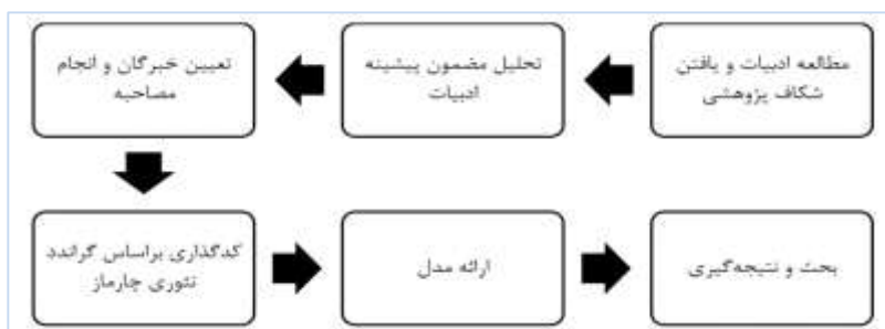
شکل ۱. فرایند انجام پژوهش

به‌طور خلاصه روش تحلیل داده‌ها شامل دو قسمت می‌شود: استفاده از روش تحلیل مضمون و استفاده از نظریه داده بنیاد و پژوهش کنونی منطبق با فرضیات پارادایم تفسیری است، همچنین به دلیل آن‌که داده‌های کیفی گردآوری شده و بر اساس آن‌ها مدلی ارائه گردید، از رویکرد استقرایی بهره برده شد این پژوهش باهدف ارائه مدلی جهت ارتقا تصویر برند نیروی انتظامی می‌باشد و چنین الگویی تاکنون وجود نداشته، بنابراین جهت‌گیری بنیادی دارد. از آنجایی که نتایج حاصل از این پژوهش قابلیت اجرایی نیز دارد، یک پژوهش کاربردی هم محسوب می‌شود. بنابراین پژوهش از نوع بنیادی- کاربردی می‌باشد. مراحل انجام پژوهش در شکل ۱ آورده شده است.