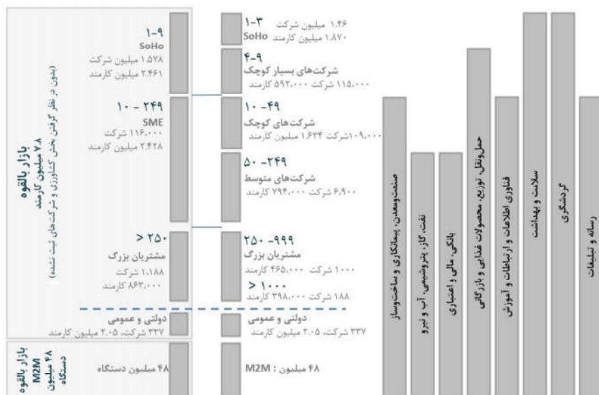
شکل ۲: بخش بندی بازار شرکتی فناوری اطلاعات و ارتباطات ایران (یافته های پژوهش، ۱۳۹۵)

با توجه به مصاحبه ها و مطالعات صورت گرفته، از میان شیوه های متعدد بخش بندی بازار شرکتی در حوزه فناوری اطلاعات و ارتباطات، عمدتاً معیارهای زیر مورد استفاده قرار می گیرند: ۱. نوع مصرف کننده نهایی مشتری شرکتی یا سازمانی ۲. اندازه یا سایز مشتری شرکتی یا سازمانی ۳. نوع صنعت یا زمینه فعالیت مشتری شرکتی یا سازمانی. این معیارها باعث خواهد شد تا بخش بندی بازار شرکتی این حوزه، قابلیت اندازه گیری، دسترسی، سودآوری و پاسخ دهی که از معیارهای بخش بندی موفق است، داشته باشد. شایان ذکر است موارد فوق به عنوان معیارهای اصلی هستند، به عبارت دیگر در ادامه بخش بندی و جزیی تر کردن آن، معیارهای دیگر نیز ممکن است به فراخور مورد استفاده قرار گیرند. ۱ بر این اساس، بازار شرکتی در این حوزه، شامل سه دسته بندی عمده از مشتریان است. این سه گروه عبارتند از: ۱. شرکت ها و سازمان های خصوصی که برای استفاده خود، کارکنان یا مشتریان شان، محصولات یا سرویس ها را خریداری می کنند. ۲. سازمان ها و نهادهای دولتی